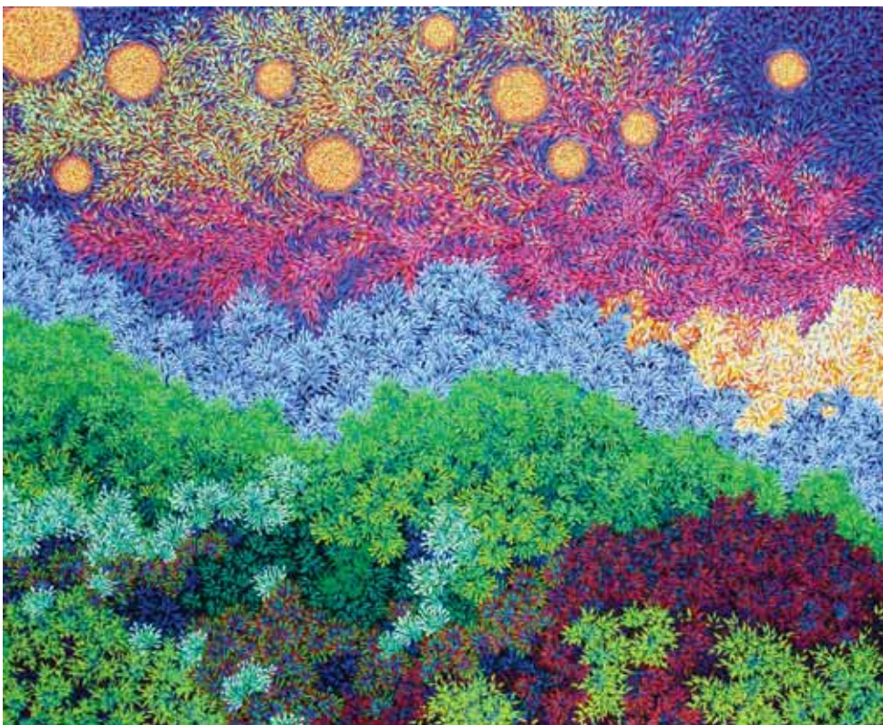
Message, 120 x 100 cm

“Slike Johnathana A. Robertsa doimaju se neobične, drugačije, u krajnjem slučaju originalne i intrigantne iz više razloga.